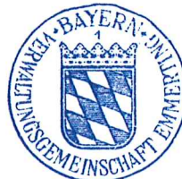
Josef Wengbauer Erster Bürgermeister Gemeinschaftsvorsitzender