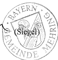
Josef Wengbauer Erster Bürgermeister