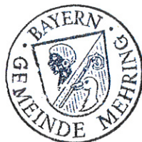
Robert Buchner Erster Bürgermeister